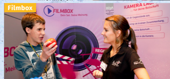
Die eigene Einstellung anderen mitteilen