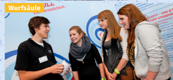
Spielend über Alltagsdrogen informieren