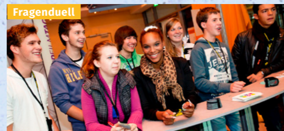
Bescheid wissen über Alkohol und Nikotin